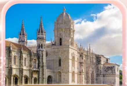
มหาวิหารเจโรนิโม