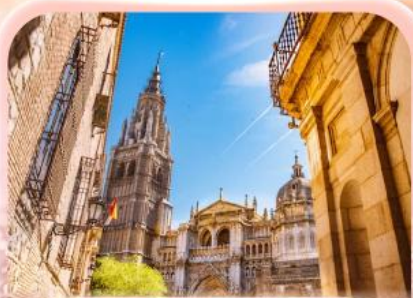
มหาวิหารแห่งโทเลโด