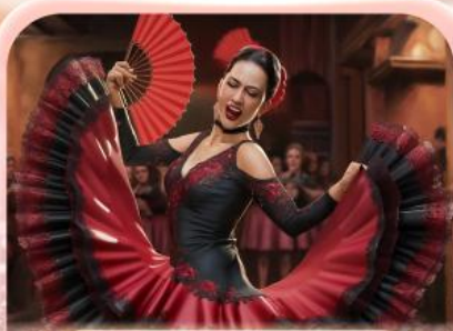
ระบำฟลามิงโก