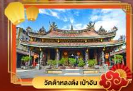
วัดต้าหลงตง เป่าอัน