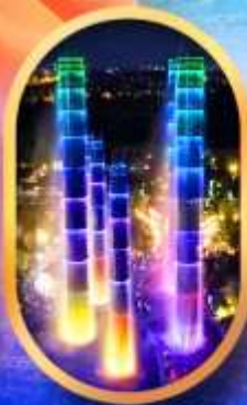
SKP Global Center