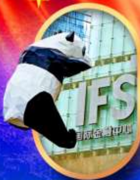
IFS หมีแพนด้าป็นตึก