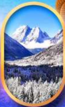
อุทยานสี่ครุณี