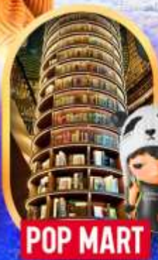
POP MART หอสมุดจงซูเก้อ