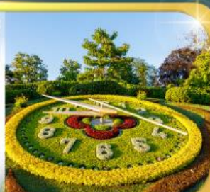
นาฬิกาดอกไม้เมืองจนีวา