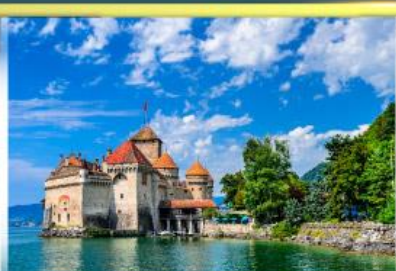
ปราสาทชิลยง