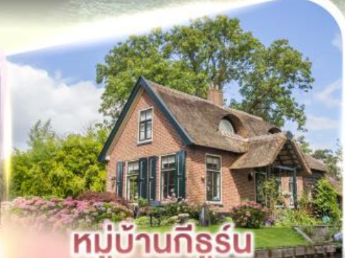
หมู่บ้านกีธูร์น