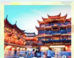
ตลาดร้อยปีเฉิงหวังเมี่ยว