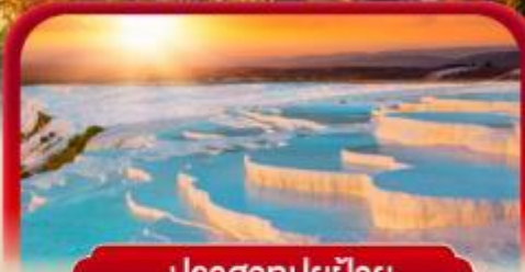
ปราสาทปูยฝ้าย