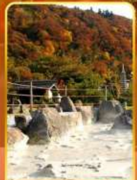
หุบเขานรกอุเซน

🌿 ออนเซ็น 2 คืน 🧳 มน.กระเป๋า 1 ใบ 23 กก 🌞 7Days 5Night