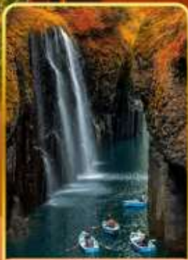
ทาคาจิโอะ(ไม่รวมสองเรือ)