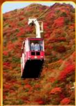
กระเช้าลอยฟ้าอุเซน