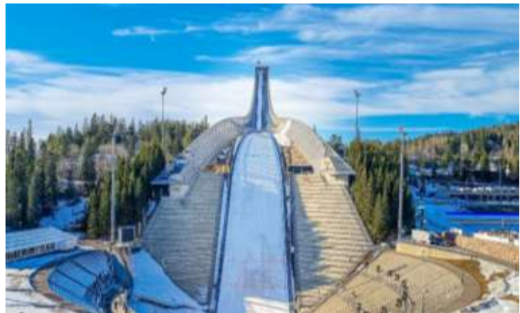
HOLMENKOLLEN SKI JUMP