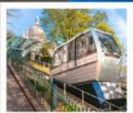
ขึ้นรถรางสู่มงมาร์ต