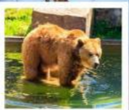
บ่อน้ำเมืองเบิร์น