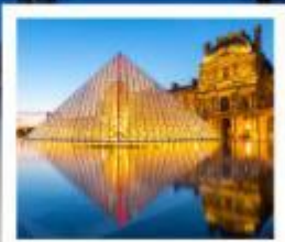
ถ่ายรูปพิพิธภัณฑ์ลูฟร์