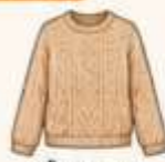
เสื้อไหมพรม