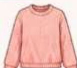
เสื้อสเวตเตอร์ถัก หรือคาร์ดิแกน