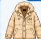
เสื้อโค้ทกันหนาว ตัวหนา