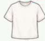
เสื้อยืด