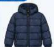
เสื้อขนเป็ด