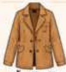
เสื้อแจ็กเก็ต หรือโค้ทตัวยาว