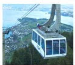
ขึ้นกระเช้ายอดเขารีกี