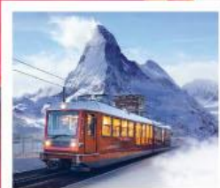
รถไฟเขาคอนเนอร์เกรต