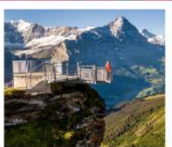
กรินเดลวาลด์เฟียส