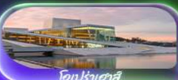
โอฟโรเฮาส์

🇳🇴 พิเศษ สองเรือจับปู นอร์เวย์ RIB Safari