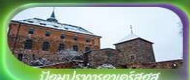
บ้อมปรอทธาเดร์สตุส