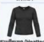
สวมฮีทเทค (Heattech) แบบหนาพิเศษด้านใน