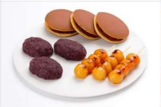
Gourmet KAKIYASU Kofukudo