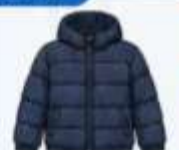
เสื้อขนเป็ด