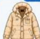
เสื้อโค้ทกันหนาว ตัวหนา