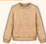
เสื้อไหมพรม