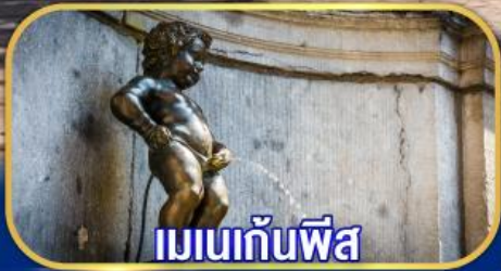
เมเนกันพีส