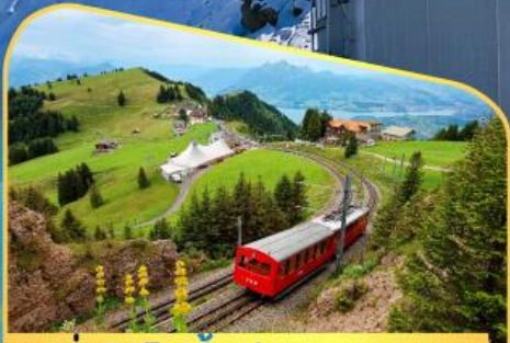
นั่งรถไฟขึ้นสู่ยอดเขาโรทิก