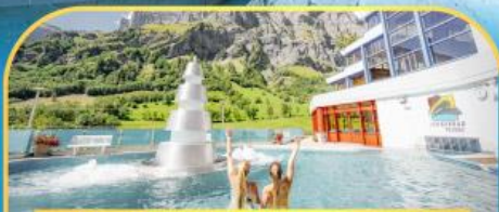
แช่น้ำแร่ร้อนผ่อนคลายลวยคอโรบิต