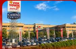
ฟ็อกซ์ทาวน์ เฮาท์เล็ท