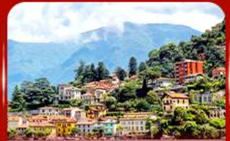
ชนวิวดสวย ทะเลสาบโคโม