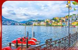
เมืองตากอากาศ ลูการ์โน