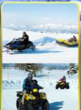
BIBAI SNOW LAND