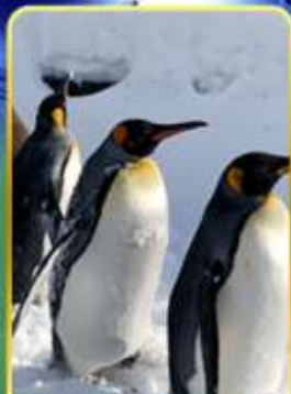
พาเหรดกวางพันวิน