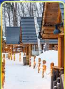
มิงเกิลเกอเร