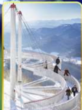
ระเบียงหมอกน้ำแข็ง