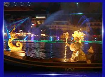
ชมโชว์เวนิสจำลอง แกรนด์เว็ลด์