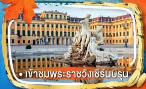
• เข้าชมพระราชวังเชิร์นบรุนน์