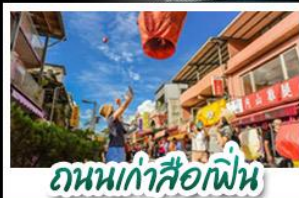
ถนนเก่าสือเฟิ่น