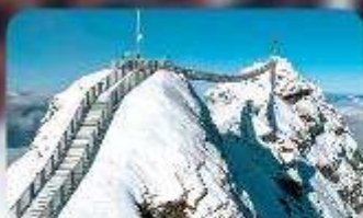
พิชิต 3 ยอดเขาตั้ง Rigi / Schilthorn / Glacier 3000