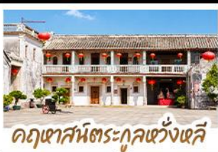
อุทยานวัฒนธรรมกุหลาบหงษ์

ตามรอยภาพยนตร์สุดซึ้งแห่งปี "จดหมายรักถึงอาม่า" • เยี่ยมเมืองโบราณเต๋จิว ดินแดนต้นกำเนิดชาวจีนโพ้นทะเลที่อพยพสู่ประเทศไทย • เดินเล่นหมู่บ้านโบราณหลงหู สัมผัสบรรยากาศเต๋จิวดั้งเดิมราวกับหลุดเข้าไปในอีกหนึ่ง • ชมย่านเมืองเก่าชิวเถาและ สวนสาธารณะเสี่ยวกงหยวน หนึ่งในสถานที่ถ่ายทำที่ได้รับความนิยมจากแฟนภาพยนตร์ ชมจดหมายโบราณอายุกว่าร้อยปี ณ พิพิธภัณฑ์จดหมายชาวจีนโพ้นทะเล