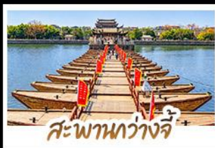
สะพานกว้างจี