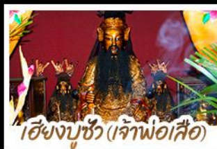
เซียงบูชิว (เจ้าพ่อเสือ)