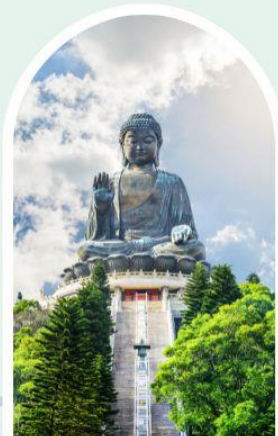
พระใหญ่โป่หลิน