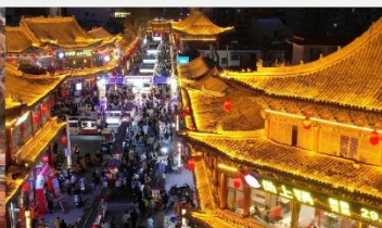
ตลาดกลางคืนจางเย่

*ทางบริษัทฯ ขอสงวนสิทธิ์ในการสลับโปรแกรมทัวร์ตามความเหมาะสมขึ้นอยู่กับสถานการณ์หน้างาน โดยคำนึงถึงผลประโยชน์ของลูกค้าเป็นสำคัญ