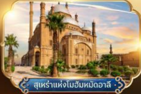
สุเหร่าแห่งโมฮัมหมัดอวาลี