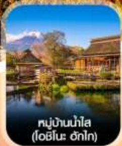
หมู่บ้านน้ำใส (โอบิโนะ ฮักโก)

เช็คอินเจแปน สัมผัสบรรยากาศใบไม้เปลี่ยนสี คามิโคจิ ชมเขื่อนฟูจิ ฌ ทะเลสาบคาวากูจิโกะ เดินเล่นเมืองเก่าคาวาโกเอะ ช้อปปิ้งชินจูกุ เกี้ยวเต็มไม่มีอิสระ พักโรงแรมออนเซ็น