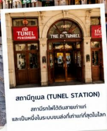
สถานีทูเนล (TUNEL STATION) สถานีรถไฟใต้ดินสายเก่าแก่ และเป็นหนึ่งในระบบขนส่งที่เก่าแก่ที่สุดในโลก