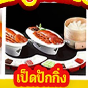
เปิดปิ้งกั๊ง