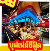
บูฟเฟต์ซีฟู้ด