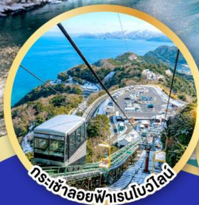
กระเช้าลอยฟ้าเรนโบว์ไลน์