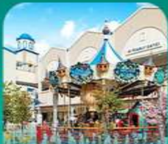
ลือชเต้ เอ้ากเก็ล