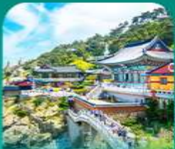
วัดแฮดงกุงกุงซา

เที่ยวปูซานแบบแกรนด์ แกรนด์ ทั้งสายอาร์ต สายบู และสายช้อปปิ้ง • เช็กอินบนท่าออร์นัสคิลเลอร์พลู ที่ท่าเรือจินบี (BUSAN BUNEZIA) เติมน้ำมันบ้านคิมชอน ซาซโดริเม่แห่งปูซานสุดน่ารัก พลาดไม่ได้กับการนั่งรถไฟปูกัน ขนวิวกะเลเมืองปูซาน • เสริมสิริมงคลที่วัดแฮดงกุงซา วัดริมทะเลชื่อดัง พร้อมช้อปปิ้งที่ลือชื่อเตรียมเจ้าก๊อ และตลาดบันโพดง ก่อนปิดท้ายด้วย ย่านวีฮงสุดชิค ซอ มยอง ออเนิว พร้อมชมวิวสะพาน ควังอินยามค่าขึ้นสุดโรแมนติก