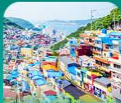
หมู่บ้านดัมซอน