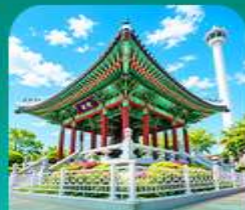
สวนงนดูลซาน