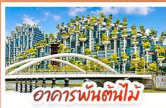
อาคารพันตันใหม่