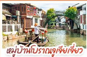
หมู่บ้านโบราณซูเจียงเจี๋ย

สวนสนุกเซี่ยงไฮ้ดิสนีย์แลนด์ เต็มวัน (รวมรถรับ-ส่ง)