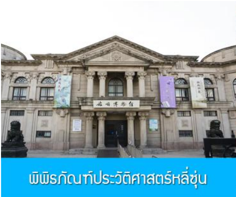
พิพิธภัณฑ์ประวัติศาสตร์หลี่ซุ่น

นำท่านเที่ยวชมและเก็บภาพ ณ สถานีรถไฟหลี่ซุ่น 旅顺火车站 เป็นสถานีปลายทางของเส้นทางรถไฟสาขา เส้นหยาง - ต้าเหลียน สร้างขึ้นในปีค.ศ. 1903 ออกแบบโดยสถาปนิกชาวรัสเซีย เป็นอาคารอิฐก่อปูนผสม โครงสร้างไม้ตามสถาปัตยกรรมรัสเซีย.