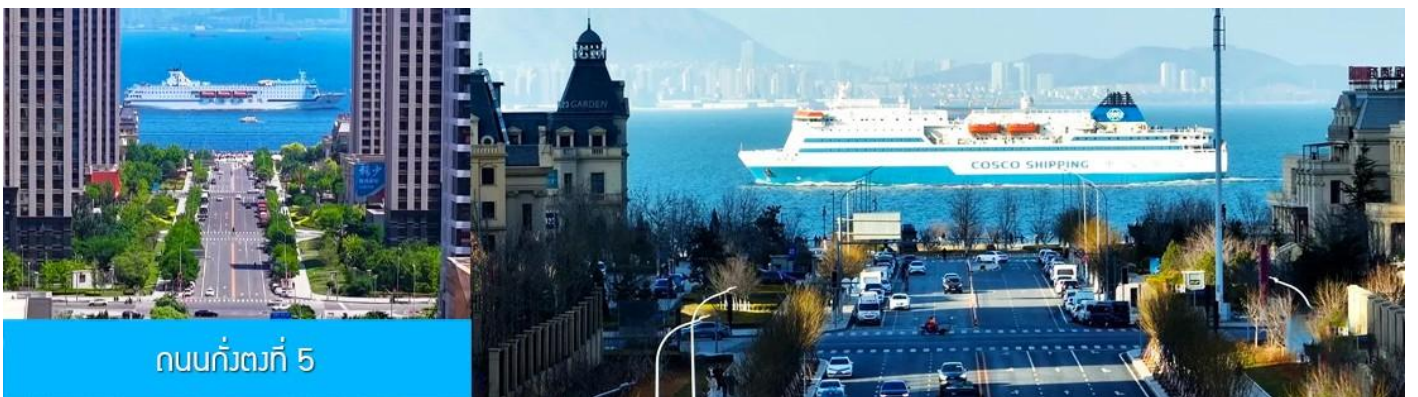
ถนนกว้างที่ 5

จากนั้นนำท่านเที่ยวชม สวนน้ำเมืองเวนิสตะวันออก 大连东方威尼斯城 เป็นเมืองเวนิสจำลองที่ถูกสร้างขึ้นด้วยทุนกว่า 8,000 ล้านดอลลาร์ ออกแบบโดยบริษัท ARC จากประเทศฝรั่งเศส โดยจำลองผังเมืองเวนิสในประเทศอิตาลี บนพื้นที่กว่า 400,000 ตารางเมตร ประกอบด้วยคลองเวนิสและอาคารที่มีสถาปัตยกรรมแบบตะวันตกกว่า 200 หลัง มีบริการล่องเรือคอนโดล่าแก่นักท่องเที่ยว นำท่านเดินชม ถ่ายภาพที่ระลึกท่ามกลาง