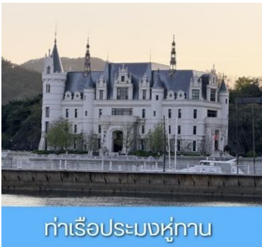
ท่าเรือประมงหู่กาน

พักที่ DALIAN JUZISHUIJING HOTEL หรือ โรงแรมระดับ 4 ดาวท้องถิ่น เมืองต้าเหลียน