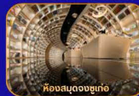
ห้องสมุดจงซูเก่อ