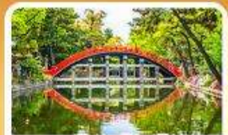
ศาลเจ้าสุมิโยชิ โกเบ