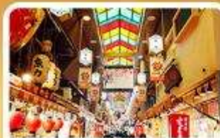
ตลาดปลาชิชิ