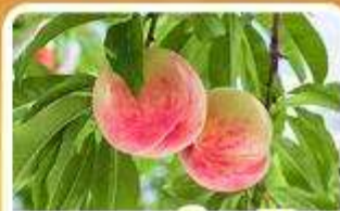
กิจกรรมเก็บผลไม้