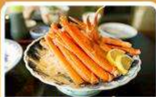
พิเศษ! ซาซิมิ