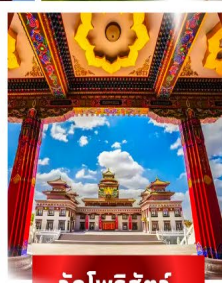
วัดโพธิ์สัตว์