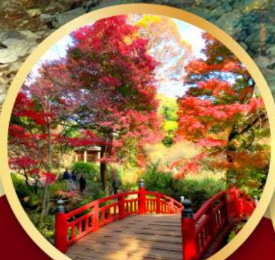
สวนดอกบ๊วยอาคางิ