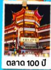
ตลาด 100 ปี