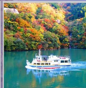
"SHOGAWA YURAN CRUISE"