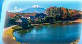
โอชิโนะอัทโท