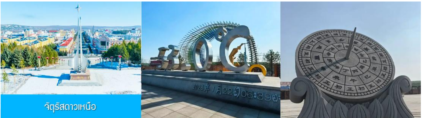
จัตุรัสดาวเหนือ