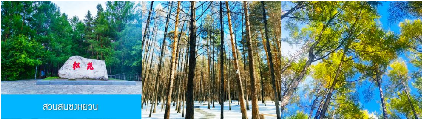
สวนสนขงหยวน

เช้า รับประทานอาหารเช้า ณ ห้องอาหารของโรงแรม (22)