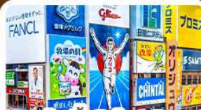
ช้อปปิ้งชินโซบาชิ และโดตงโมริ