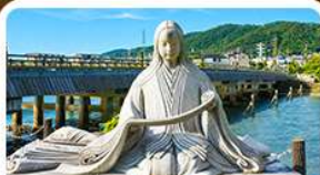
เมืองอจิจิ สวรรค์คนรักชาเขียว