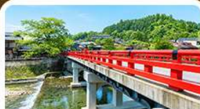
สะพานนากะบาชิ ทาคายามา