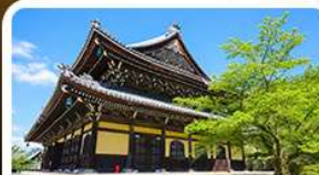
วัดนันเซ็นจิ