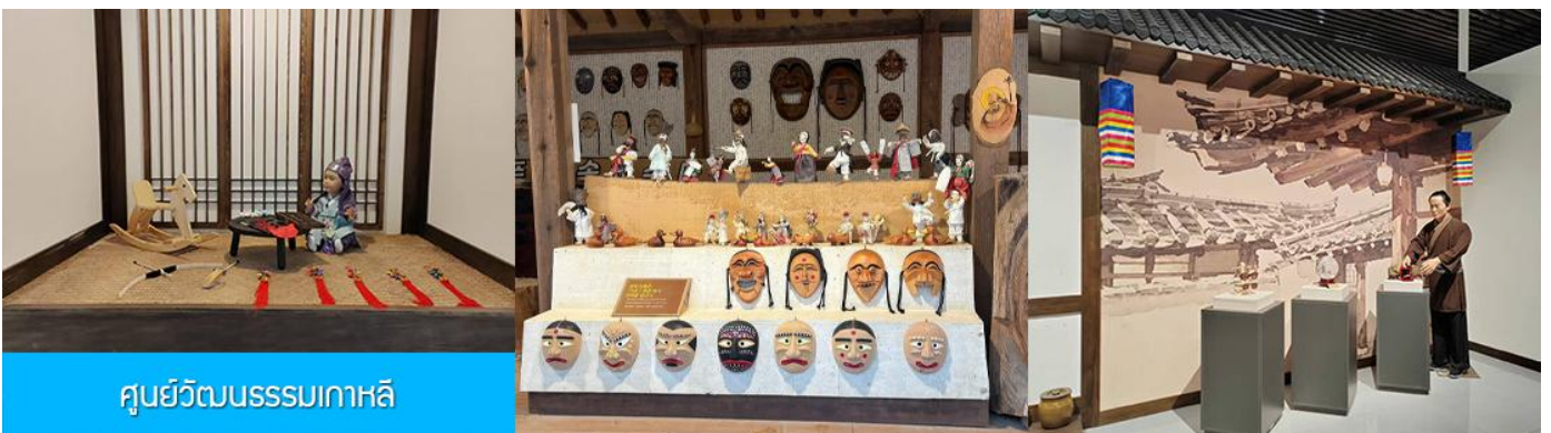
ศูนย์วัฒนธรรมเกาหลี

เช้า รับประทานอาหารเช้า ณ ห้องอาหารของโรงแรม (9)