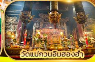
วัดแม่กวนอิมของฮ่า