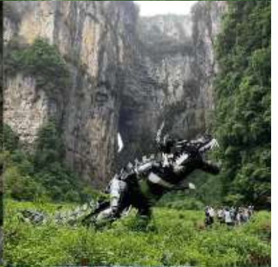
THREE NATURAL BRIDGE