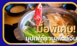
มือพิเศษ! บุปเป็ดชาบูสไต้อุ่น