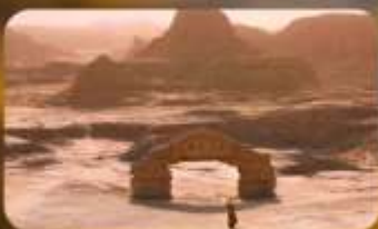
เมืองปีศาจ