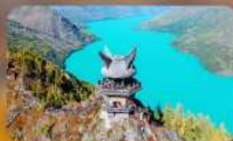
ศาลาชมปลา