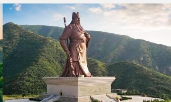
บ้านเกิดท่านกวนจู