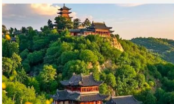
เขาเหยาหวังชาน