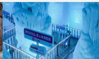
ถ้ำน้ำแข็งอวี่นชีวซาน

*ทางบริษัทฯ ขอสงวนสิทธิ์ในการสลับโปรแกรมทัวร์ตามความเหมาะสมขึ้นอยู่กับสถานการณ์หน้างาน โดยคำนึงถึงผลประโยชน์ของลูกค้าเป็นสำคัญ