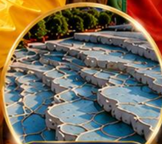
ปามุกคาล่า Pamukkale