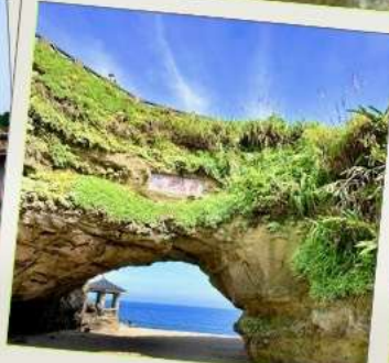
ถ้ำสี่เหมิน